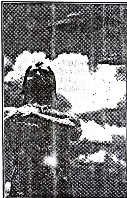
Era Araribóia um astronauta?