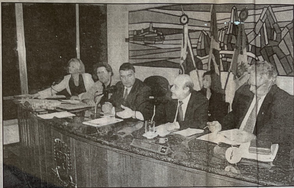
Organizadores do EcoCine foram ao plenário da Câmara explicar como será o projeto